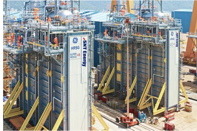
Heat Recovery Steam Generator