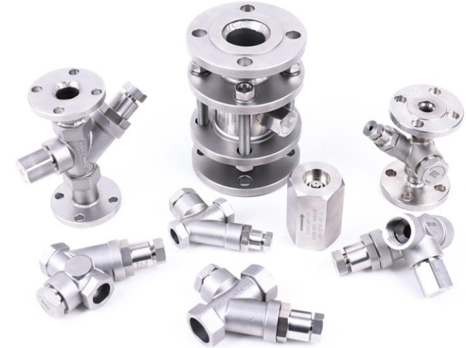
<DST Venturi steam trap>