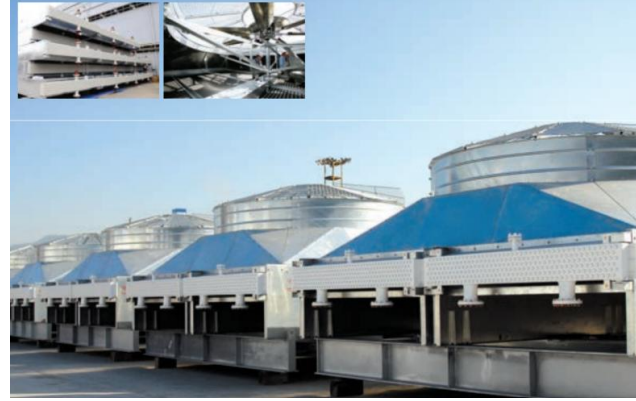
Air Cooled Heat Exchanger