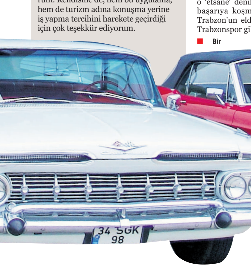
Şükrü Köleoğlu en büyük tutkusu olan 3 antika otomobile de gözü gibi bakıyor