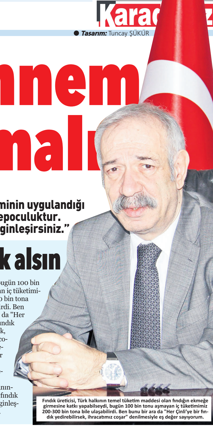
Fındık üreticisi, Türk halkının temel tüketim maddesi olan fındığın ekmeğe girmesine katkı yapabileseydi, bugün 100 bin tonu aşmayan iç tüketimimiz 200-300 bin tona bile ulaşabilirdi. Ben bunu bir ara da "Her Çiñli'ye bir fındık yedirilirse, ihracatımız coşar" denilmesiyle eş değer sayıyorum.

Trabzon'un gelecek için elde kalan en önemli varlıklarının dağ ve yaylalar olduğunu artık herkes kabul ediyor. Dağlarımız ve yaylalarımıza sanayi tesisleri kurmak ve beton yapılar kondurmak, Cennet'e Cehennem çukuru açmak gibidir.